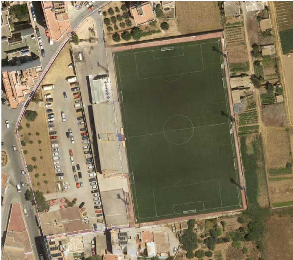
Ámbito propuesto sobre la ortofoto de 2004 del IDEIB.

Para ello se cuenta con un levantamiento topográfico que determina que el ámbito real de la ASU es actualmente de 6.380 m 2 en vez de los 7.720 m 2 establecido en la ficha del PGOU y de ellos, como se ha señalado, se encuentran ya cedidos 2.363,61 m 2 . No obstante, actualmente se requiere obtener la cesión adicional de suelo no prevista en el PGOU destinada a la ampliación de la calle Antònia Cala al resultar ésta demasiado estrecha para disponer de una movilidad rodada y poder dar en un futuro acceso a la estación de autobuses.