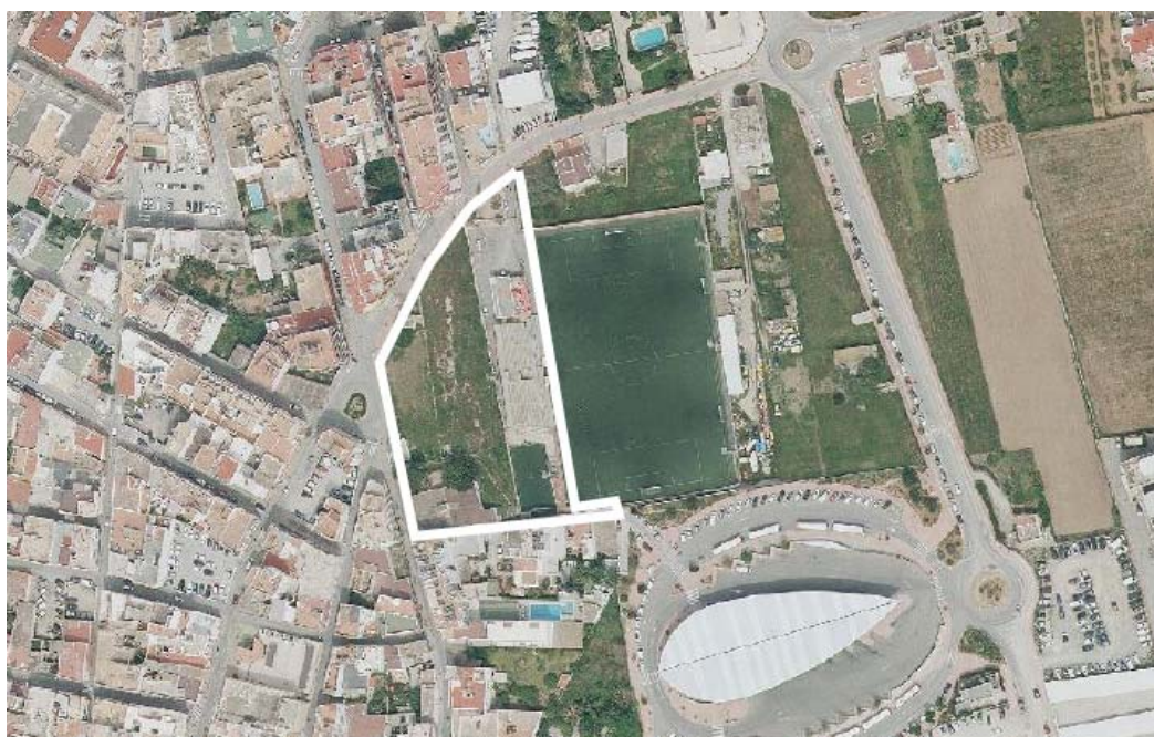
Ámbito de la ASU 33/02 del PGOU sobre la ortofoto aérea de 2018.

Todo ello puede ser establecido directamente por el PGOU mediante el procedimiento establecido en el artículo 73 de la Ley 12/2017, de 29 de diciembre, de urbanismo de las Illes Balears (BOIB n. 160, de 29.12.17), en adelante LUIB.