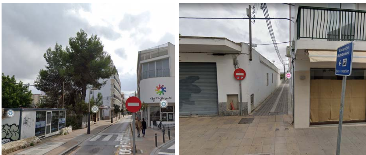
Calle de Ramón y Cajal y Calle Antònia Cala.

En la nueva ficha propuesta no se ha incluido la superficie de suelo de cesión de la calle Antònia Cala que se presume ya cedida ni la del equipamiento público en una superficie de: 2.363,61 m 2 ya que se efectuó su cesión de forma anticipada en 2006 y se encuentra ocupada actualmente por las instalaciones del campo de fútbol.